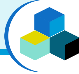
Diagrama e rezultateve